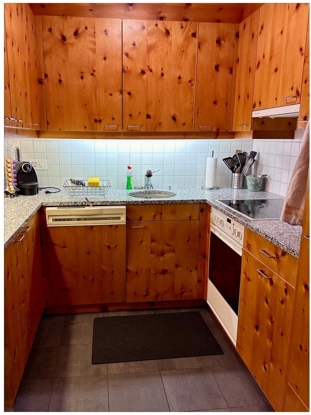
Küche - offen zum Esszimmer