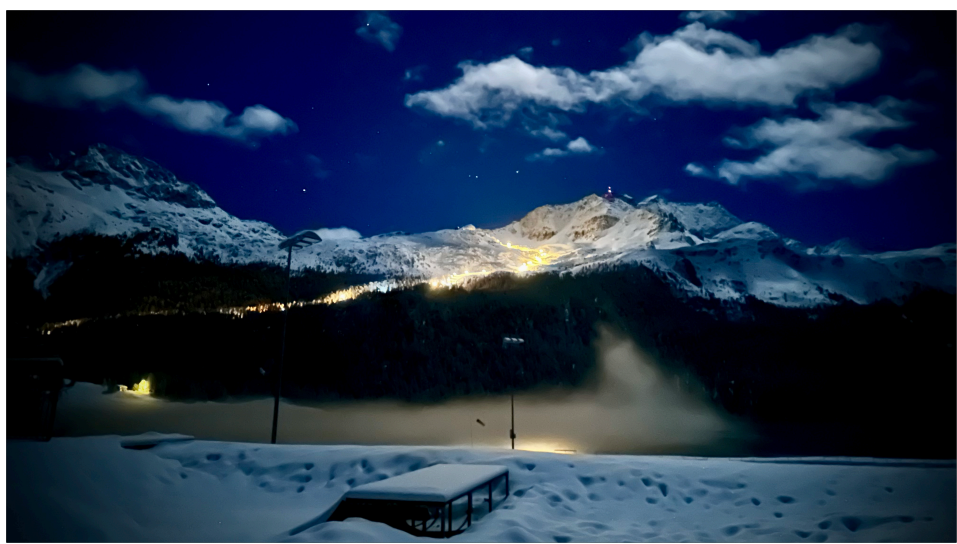
Blick Richtung Corvatsch - Nachtskifahren vom Sportzentrum Mulets am See aus